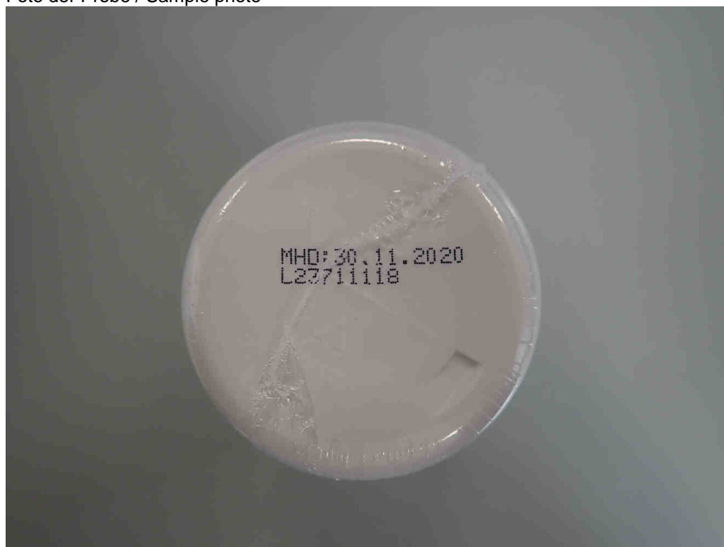
Foto der Probe / Sample photo