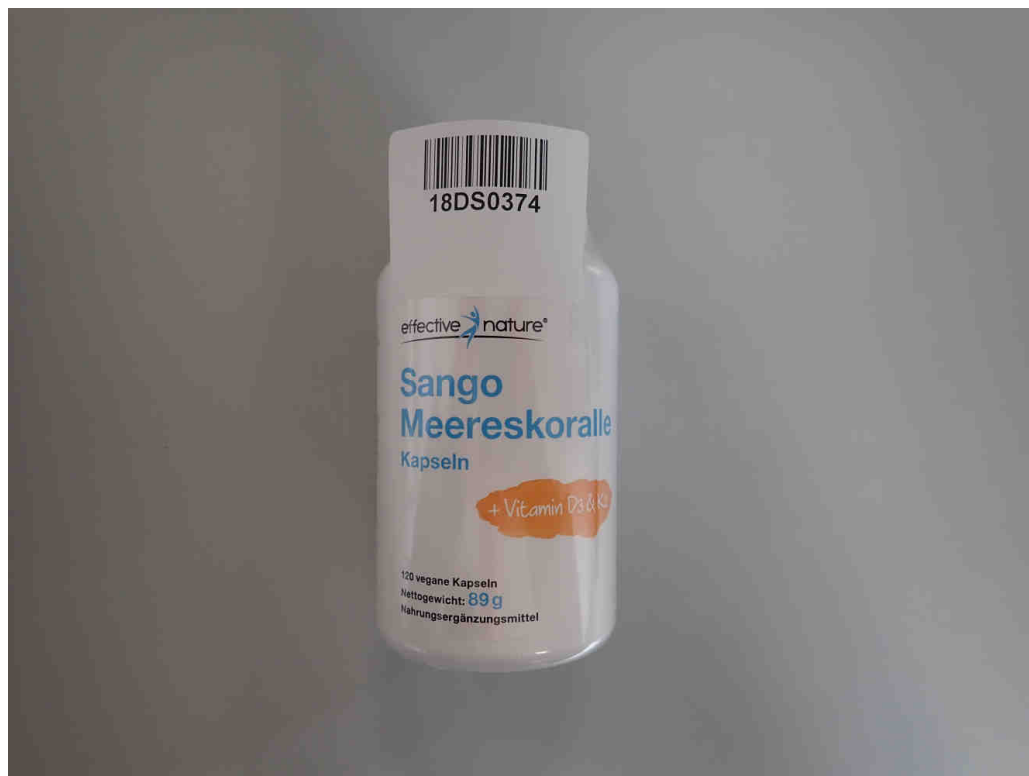
Foto der Probe / Sample photo