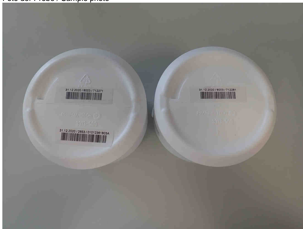
Foto der Probe / Sample photo