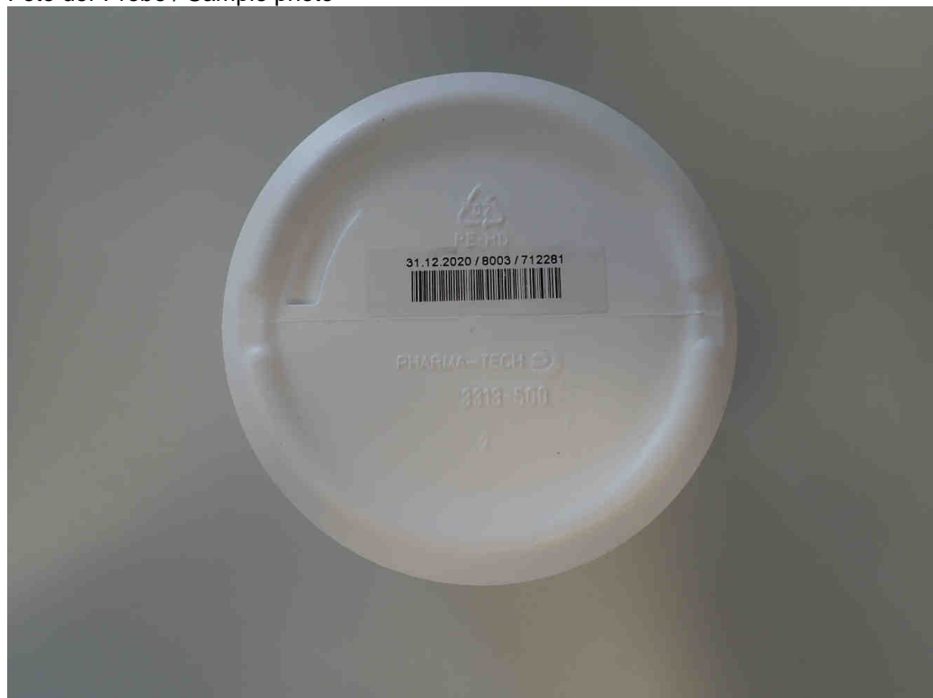
Foto der Probe / Sample photo